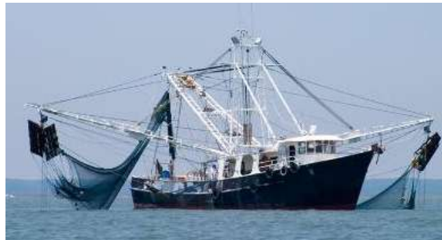
radarral ellátott halászhajó